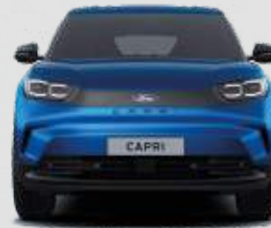
Szerokość całkowita z lusterkami: 2063 mm