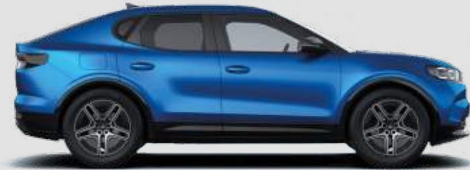
Długość całkowita: 4634 mm