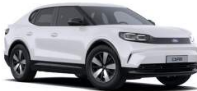
FROZEN WHITE - LAKIER ZWYKŁY 1 500 zł