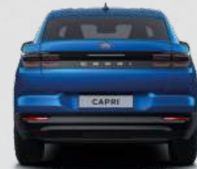
Szerokość całkowita ze złożonymi lusterkami: 1946 mm