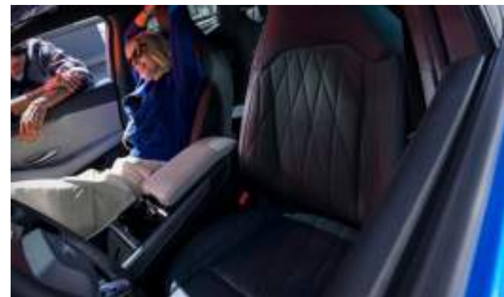
PRZEDNIE FOTELE ERGONOMICZNE, Z CERTYFIKATEM AGR