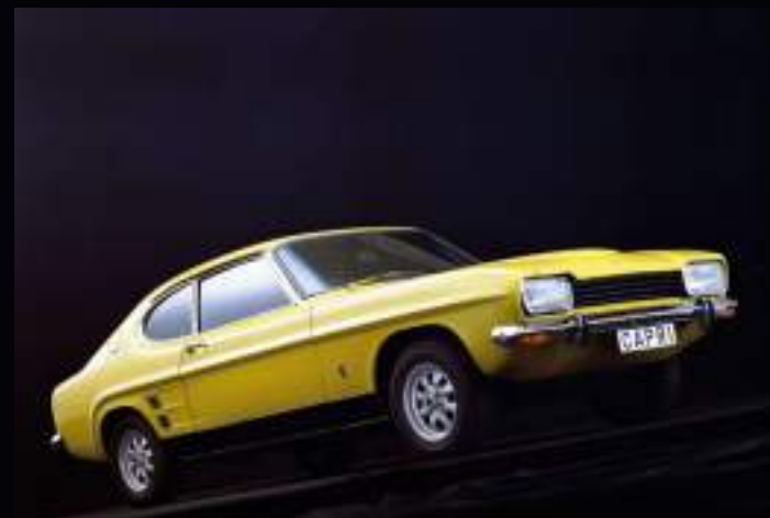
Ford Capri I generacji był produkowany w latach 1968 - 1986

Kolor nadwozia: Po lewej stronie - Blue My Mind (opcja), po prawej stronie - Vivid Yellow (bez dopłaty)