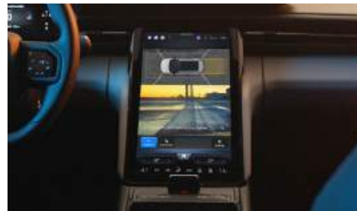
ACTIVE PARK ASSIST - SYSTEM WSPOMAGAJĄCY PARKOWANIE

Opcja dostępna tylko w pakiecie Driver Assistance