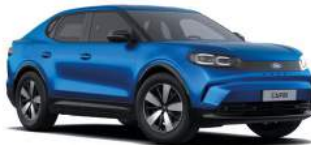
BLUE MY MIND - LAKIER METALIZOWANY SPECJALNY 4 500 zł