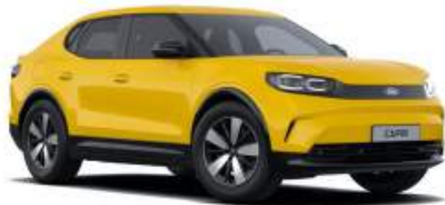
VIVID YELLOW - LAKIER ZWYKŁY bez dopłaty