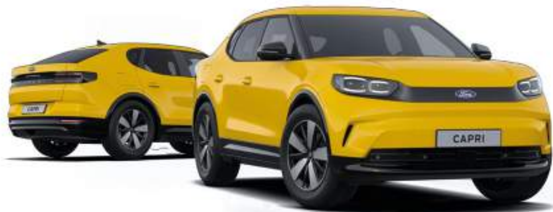
Nowy Ford Capri w wersji Capri z 19" obręczami ze stopów lekkich (standard dla wersji z bateriami o zwiększonej pojemności) oraz lakierem zwykłym Vivid Yellow (bez dopłaty)