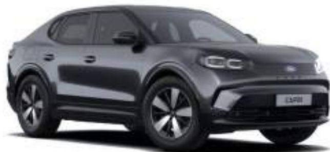
MAGNETIC GREY - LAKIER METALIZOWANY 3 000 zł