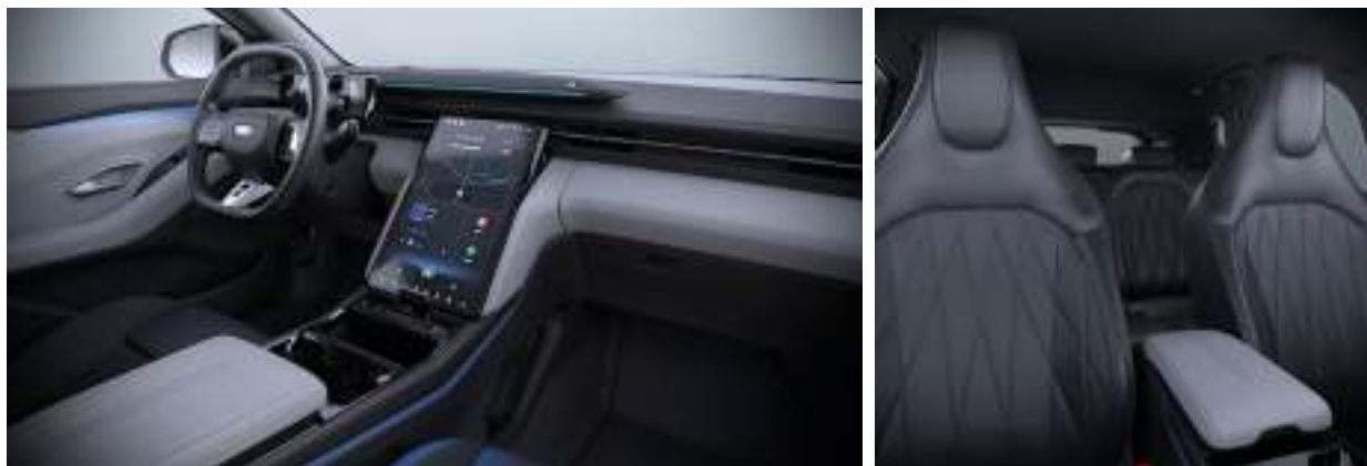
Nowy Ford Capri w wersji Premium z tapicerką skórzaną - skóra ekologiczna Sensico (standard)