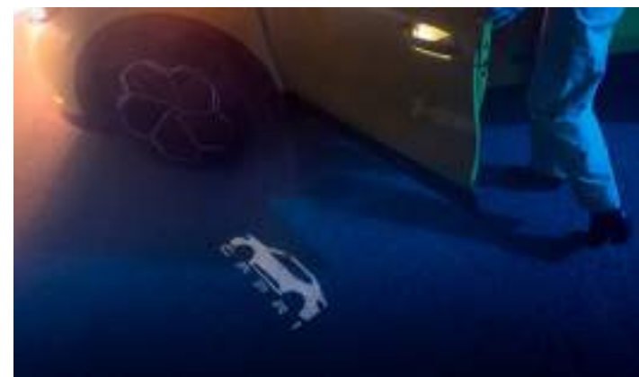
LUSTERKA BOCZNE Z PROJEKCJĄ LOGO CAPRI