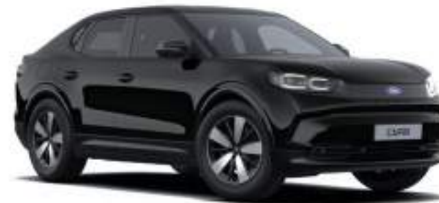
AGATE BLACK - LAKIER METALIZOWANY 3 000 zł