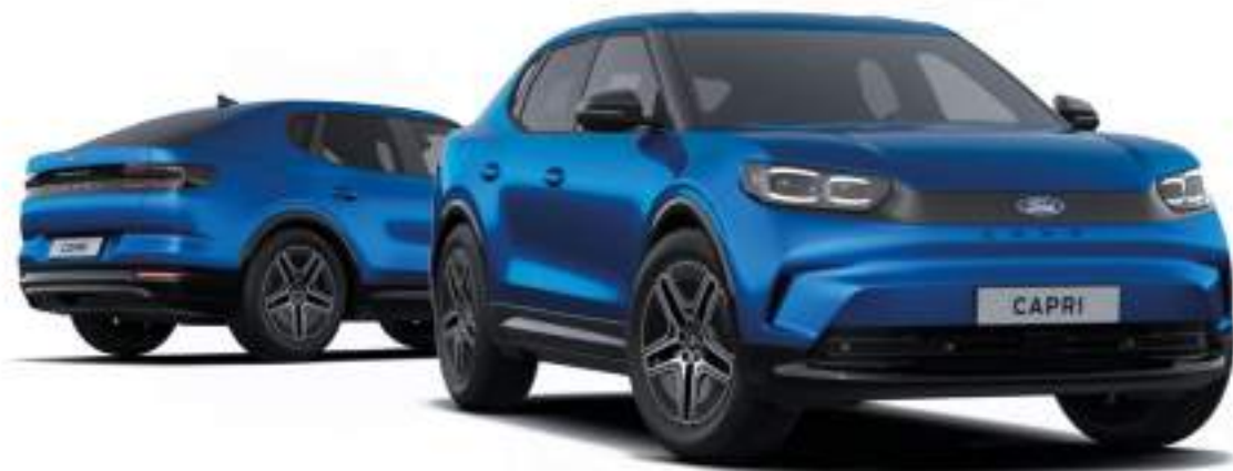
Nowy Ford Capri w wersji Premium z lakierem metalizowanym Blue My Mind (opcja)