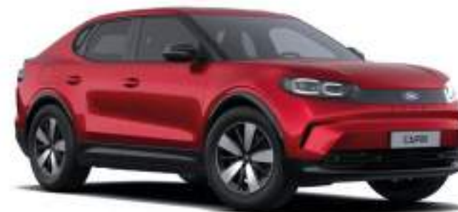
LUCID RED - LAKIER METALIZOWANY SPECJALNY 4 500 zł