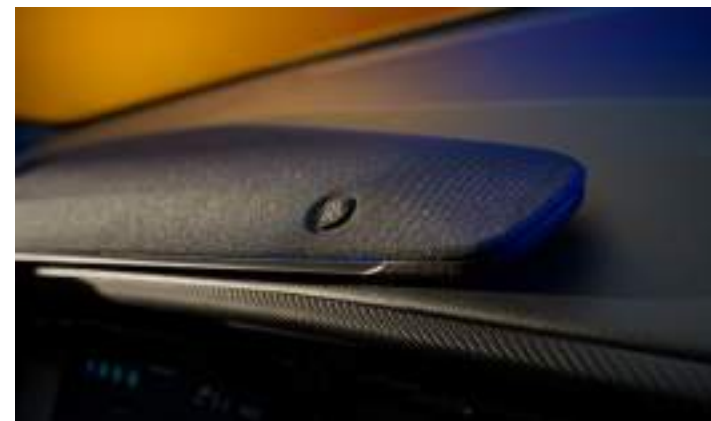
SYSTEM NAGŁOŚNIENIA PREMIUM B&O